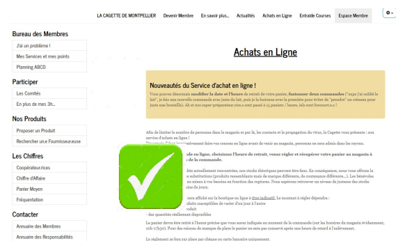
Nouvel Espace Membre

Depuis plus de 6 mois, nous avons un nouveau site internet et un nouvel Espace Membre . Attention, certain-e-s d'entre vous utilise encore l'ancien Espace Membre qui n'est plus actif (vous y avez encore accès car vous l'avez ajouté à vos favoris, mais il n'est plus mis à jour depuis des mois).