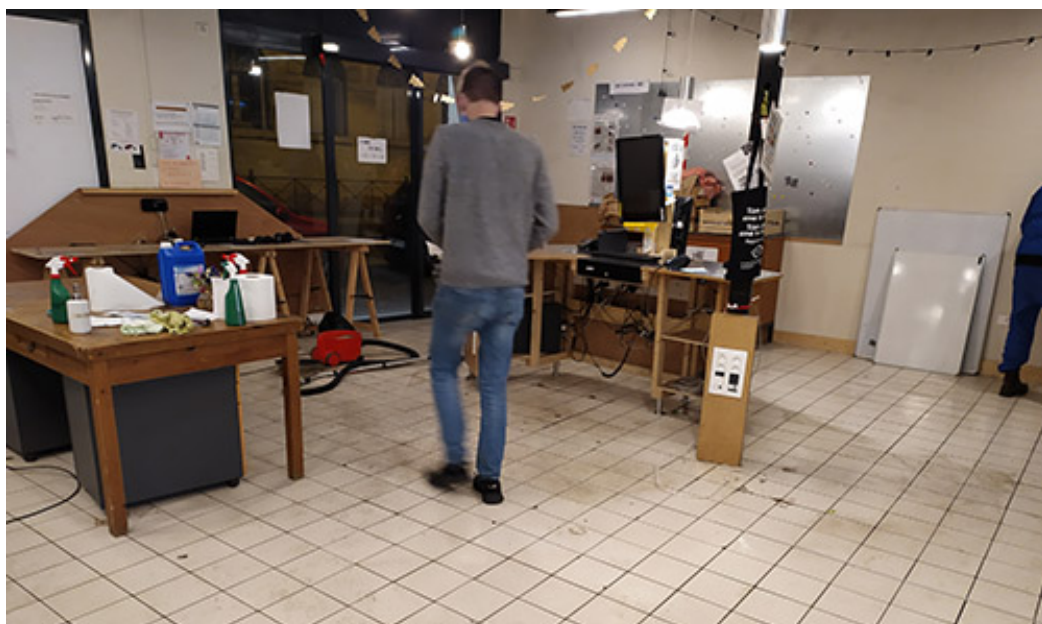
Réaménagement et déménagement d'une partie du matériel